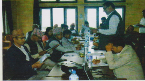
(२०७६/५/१३ गते राष्ट्रिय किसान आयोगको सभाहलमा किसान संघ, संगठन, संजालहरूसँग बैठक तथा अन्तरक्रिया)

दूधको गुणस्तरमा हास भएकोले घाँसमा आधारित उत्पादन अपनाउनेलाई प्रोत्साहन दिने र फ्याट एवम् एस. एन. एफ. मात्रको आधारमा मात्र नभै गुणस्तरको पूर्ण स्वरूपको मापदण्ड अपनाउनु पर्ने, यसका लागि तीनै तहका सरकारबाट सहयोग गर्ने र कार्यान्वयनको अनुगमन गर्ने।