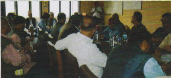
(राष्ट्रिय किसान आयोगको सभाहलमा विज्ञहरूसँग २०७६/४/१२ गते बैठक तथा अन्तरक्रिया)

भू-उपयोग भौगोलिक बाली विशिष्टीकरणका आधारमा गुणस्तरिय र टूलो परिमाणमा व्यवसायिक खेतीमा आधारित उत्पादन वृद्धिका लागि तीनै तहको सरकारबाट सहयोग दिने तथा लगानी बढाउनु पर्ने।