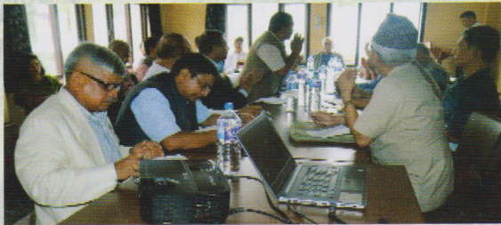
(राष्ट्रिय किसान आयोगको सभाहलमा विज्ञहरूसँग २०७६/४/९ गते बैठक तथा अन्तरक्रिया)

कार्यक्रममा खण्डित भूमिको व्यवस्थापनने प्रमुख मुद्दा रहेकोमा उत्पादन र उत्पादकत्व न्यून हुनु स्वभाविक हो, भनी सहभागीहरूबाट व्यक्त गरिएको थियो। नेपाल सरकारबाट पहिलो प्राथमिकतामा राखी भूमि व्यवस्थापनका साथै कार्यान्वयन गर्नुपर्ने।