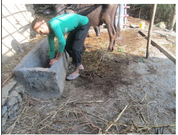
चित्र १०: रावसीराङ्ग गा.पा, मकवापुर को ७५ % अनुदानमा तयार भएको गोठ सुधार कार्यक्रम