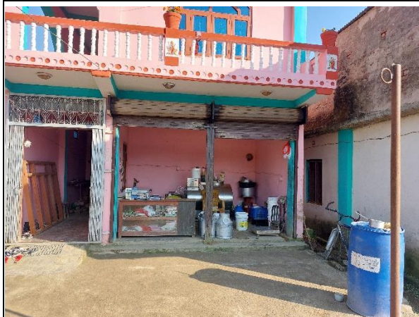
चित्र ५: कृषि क्षेत्र विकास परियोजनाको ५० % अनुदान सहयोगमा तयार भएको दुध संकलन केन्द्र (उत्तरगंगा, सुर्खेत)