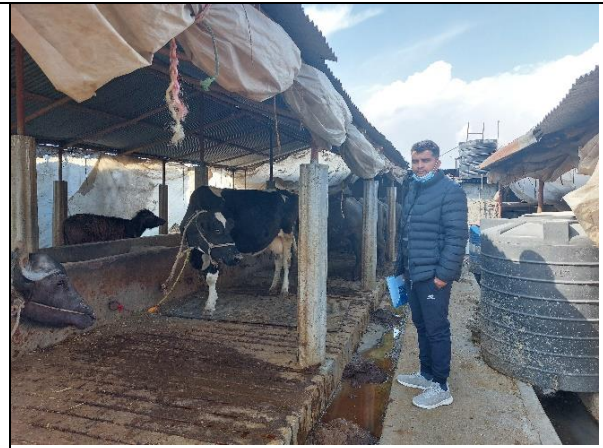
चित्र ४: कृषि अनुदान पश्चात भईरहेको कार्य प्रगतीको अवलोकन (गण्डकी प्रदेश, कास्की)