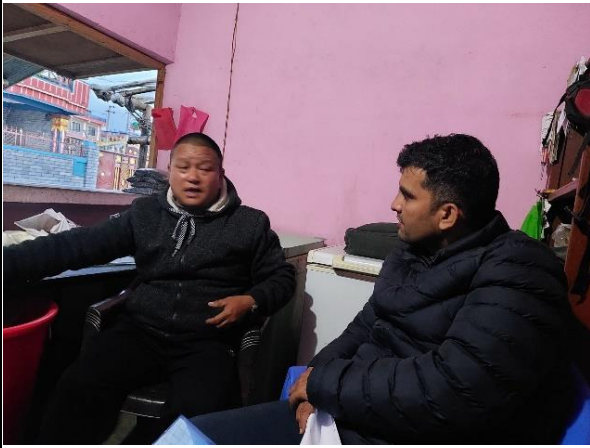
चित्र ९: कृषि अनुदान कार्यक्रमबाट लाभान्वित कृषक संग कृषि अनुदानमा भएका व्यवस्थापतिको बुझाई, अनुभव, अनुदानको पहुँचमा सहजताको अवस्थाका बारेमा छलफल