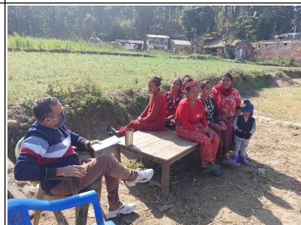
चित्र ८: कृषि अनुदान कार्यक्रमबाट लाभान्वित कृषक समूहहरु संग कृषि अनुदानमा भएका व्यवस्थाप्रतिको बुझाई, अनुभव, अनुदानको पहुँचमा सहजताको अवस्थाका बारेमा छलफल