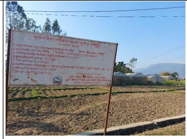
चित्र ६: भूमि व्यवस्था, कृषि तथा सहकारी मन्त्रालय (कर्णाली प्रदेश) ले अनुदान सहयोगमा तयार गरिएको तरकारी ब्बक (विरेन्द्रनगर-९, तिलपुर)