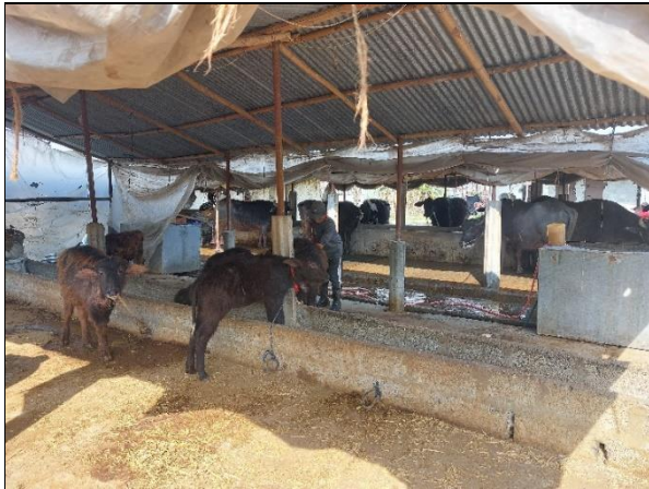
चित्र ३: कृषि ज्ञान केन्द्र कास्की बाट ५० % अनुदान बाट स्थापना गरिएको व्यवसायिक भैसी फर्म