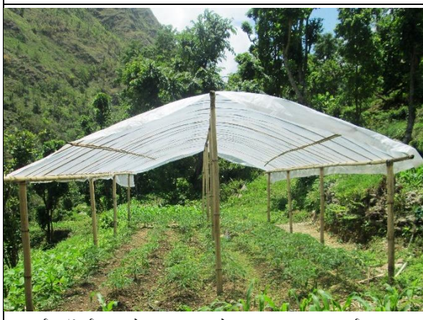
चित्र ७: कृषि ज्ञान केन्द्र, मकवापुर को ७५ % अनुदानमा व्यवसायिक टमाटर खेति गर्न तयार भएको प्लास्टिक टनेल